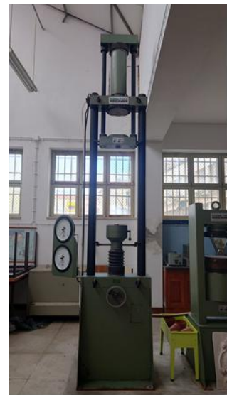
Máquina de teste de betão 3