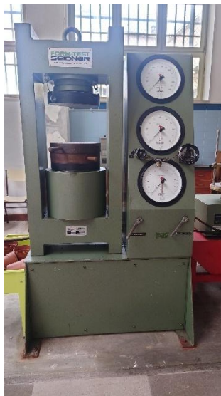
Máquina de teste de betão 2