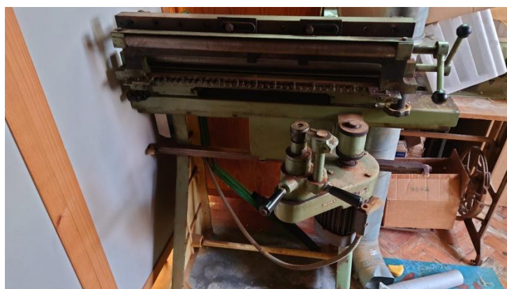
Máquina de malhetes - SCMM