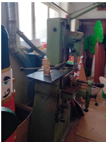
Máquina de furar por corrente - PINHEIRO