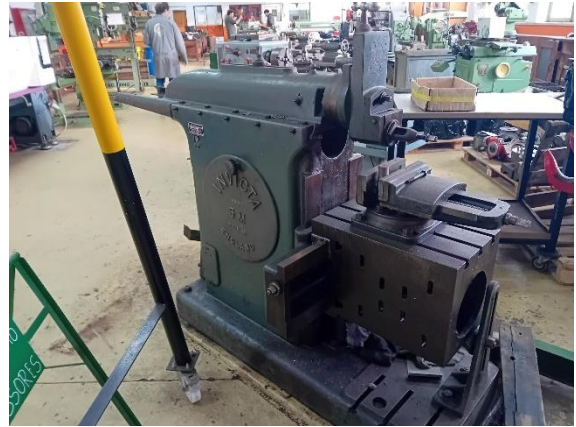
Limador mecânico INVICTA