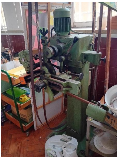
Afiador de serras – PINHEIRO