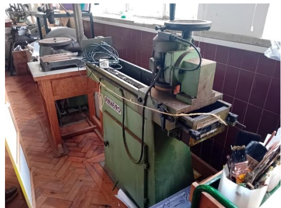
Afiador de lâminas - PINHEIRO