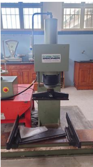
Máquina de teste de betão 1