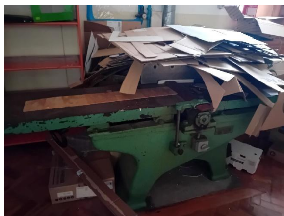
Garlopa – DORNBURG COBURG