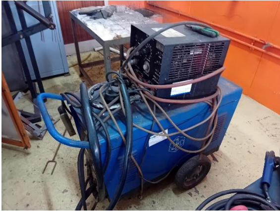
Máquina de soldar RST 350