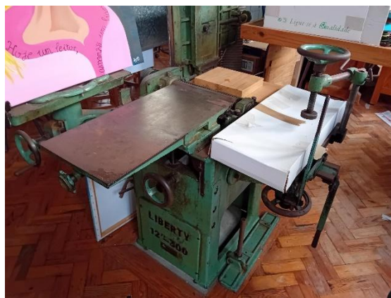
Garlopa Desengrossadeira – LIBERTY NIVERSAL)