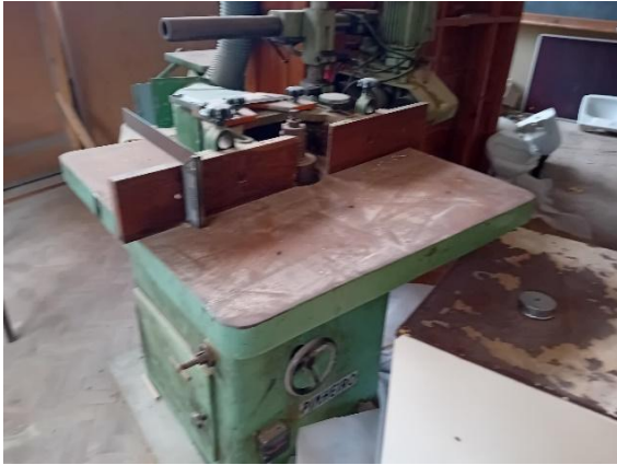
Tupia de fresas – PINHEIRO