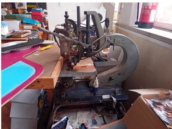
Máquina furar e recorte – MÁQUINAS DE PRECISÃO