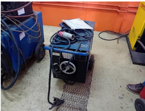
Máquina soldar TV 350