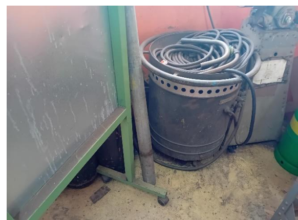
Máquina de soldar EFA