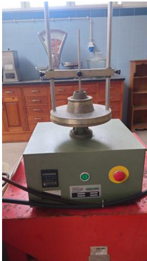
Máquina de teste de betão 4