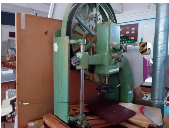
Serra de fita – PENIKA