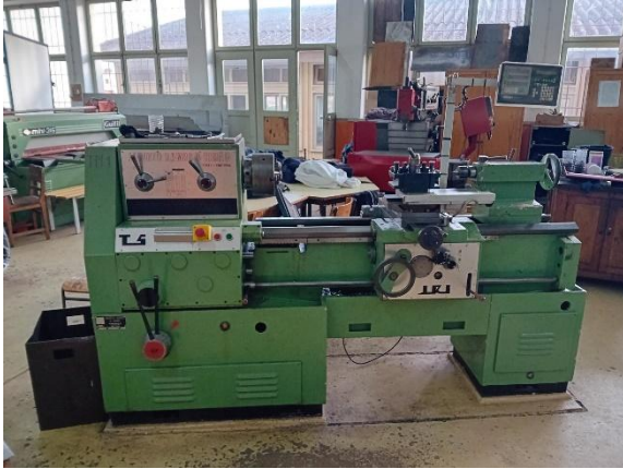
Torno mecânico JACINTO RAMOS