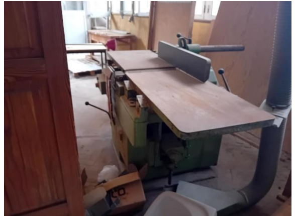
Garlopa desengrossadeira - PINHEIRO