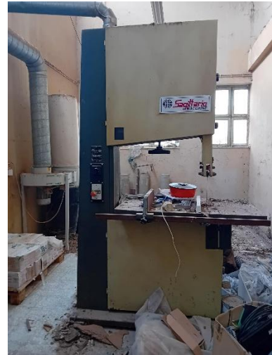
Serra de Fita - SAGITTARIO