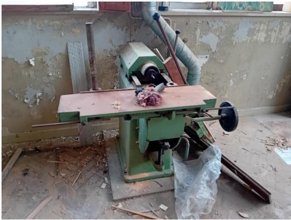
Furador - PINHEIRO