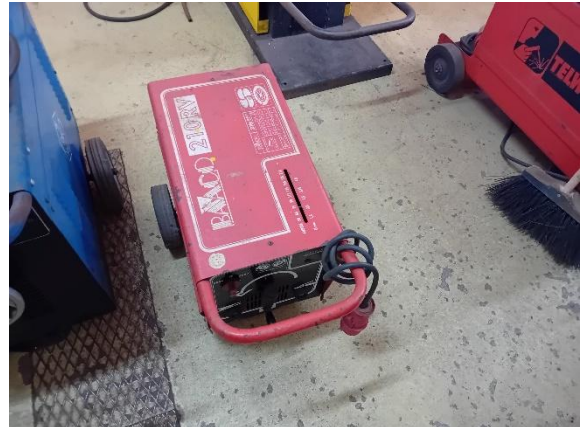
Máquina de soldar 210 RV